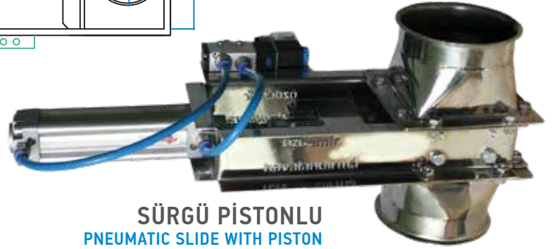
SÜRGÜ PİSTONLU PNEUMATIC SLIDE WITH PISTON ЗАСЛОНКА ПНЕВМАТИЧЕСКАЯ